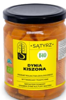
Dynia kiszona 500 ml