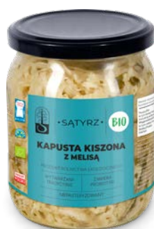
Kapusta kiszona z melisą 500 ml