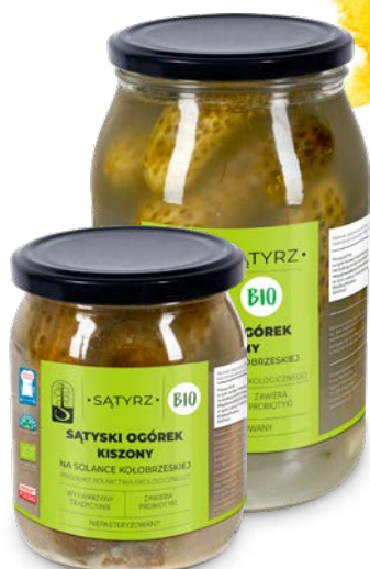
Sątyski ogórek kiszony 500 ml, 900 ml