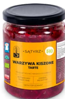
Warzywa kiszone, tarte 500 ml