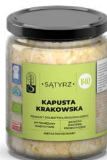
Kapusta krakowska 500ml