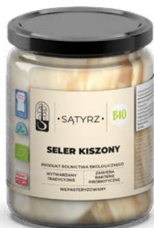
Seler kiszony 500ml