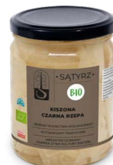
Czarna rzepa kiszona 500 ml