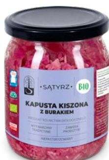
Kapusta kiszona z burakiem 500 ml