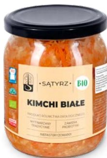
Kimchi białe 500 ml