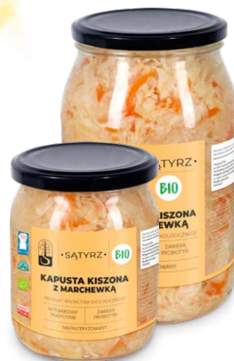
Kapusta kiszona z marchewką 500 ml, 900 ml