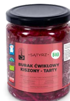
Burak ćwikłowy kiszony, tarty 500 ml