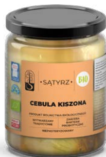
Cebula kiszona 500ml