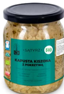
Kapusta kiszona z pokrzywą 500 ml