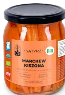
Marchew kiszona 500 ml