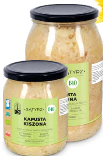
Kapusta kiszona 500 ml, 900 ml