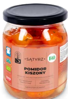
Pomidor kiszony 500 ml, 900 ml