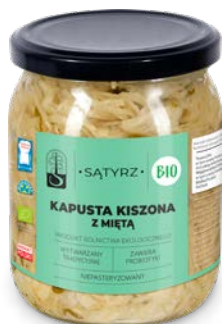
Kapusta kiszona z miętą 500 ml