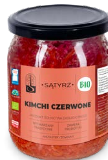
Kimchi czerwone 500 ml