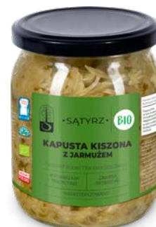
Kapusta kiszona z jarmużem 500 ml