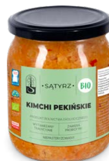
Kimchi pekińskie 500 ml