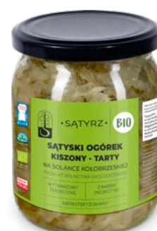
Sątyski ogórek kiszony, tarty 500 ml