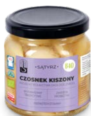
Czosnek kiszony 200 ml