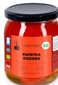
Papryka kiszona 500 ml