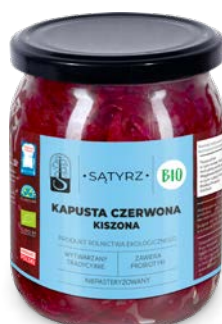
Kapusta czerwona kiszona 500 ml