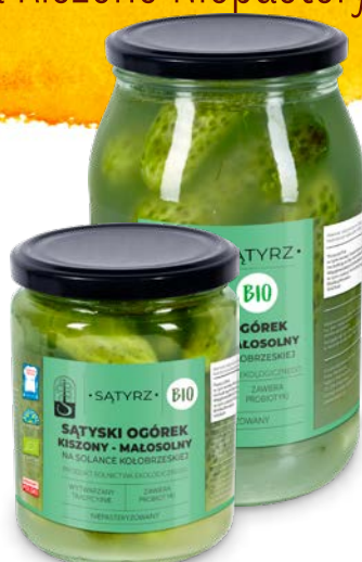
Sątyski ogórek kiszony, małosolny 500 ml, 900 ml