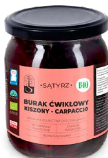
Burak ćwikłowy kiszony, carpaccio 500 ml