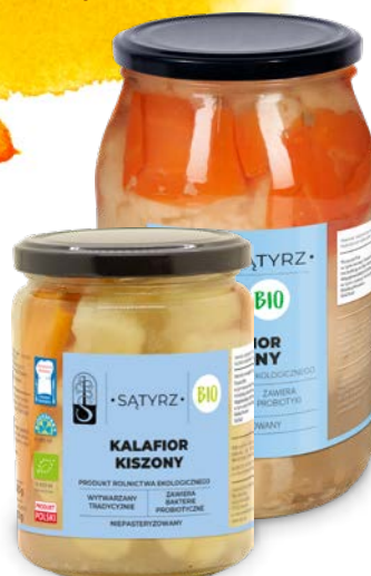
Kalafior kiszony 500ml, 900 ml