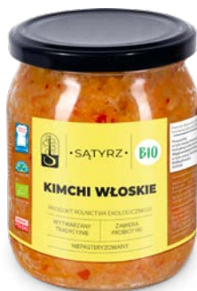
Kimchi włoskie 500 ml