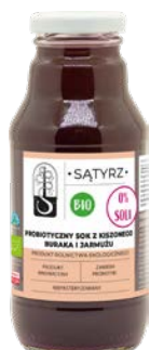
Sok z kiszzonego buraka z jarmużem 300 ml

Soki Niepasteryzowane Probiotyczne 0% SOLI