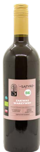
Zakwas warzywny 700 ml