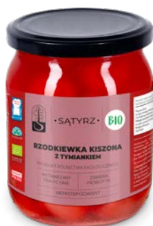
Rzodkiewka kiszona z tymiankiem 500 ml