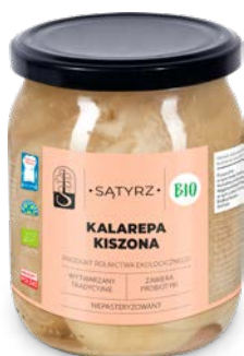
Kalarepa kiszona 500 ml