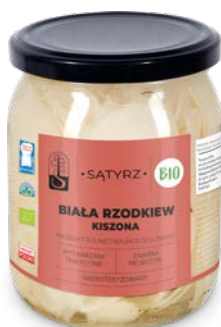
Biała rzodkiew kiszona 500 ml