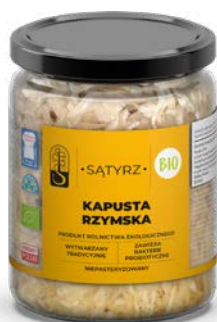
Kapusta rzymska 500ml