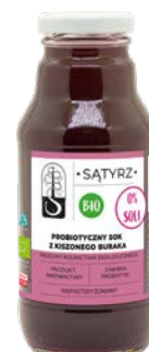
Sok z kiszzonego buraka 300 ml